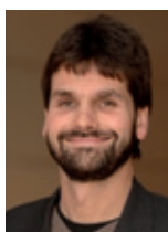
Gernot Gottwals „Italiens Spuren in Frankfurt“ stadtteilübergreifend