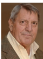
Horst Nopens „Gedichtete Geschichte zur Grünen Soße“ Stadtteil: Oberrad