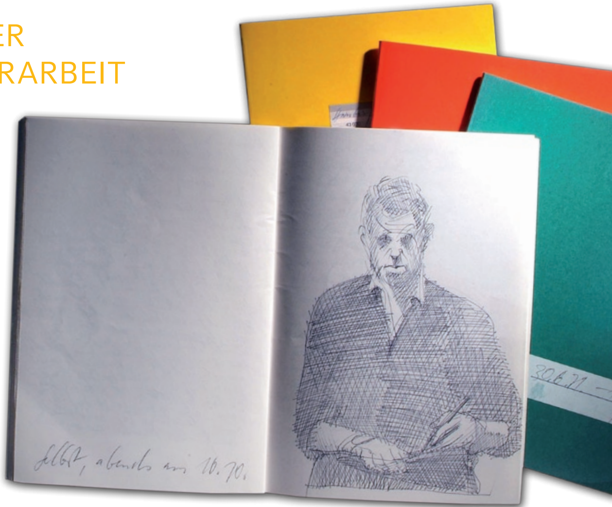
Die Brunnen-Hefte Gernhardts: Eine Dokumentation unerschöpflicher Kreativität