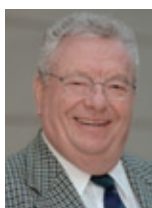
Manfred Kühn „Die Frankfurter Ziegelwerke in Praunheim“ Stadtteil: Praunheim