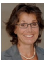
Claudia Kauter „100 Jahre Schiller- schule in Frankfurt- Sachsenhausen“ Stadtteil: Sachsenhausen