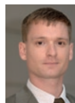
Marc Nördlinger „Die Infrastruktur- und Energiepolitik der Stadt Höchst am Main von 1860 bis 1928“ Stadtteil: Höchst