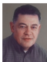
Gerhard Cullmann „Liegenschaften und Häuser der Familie Rothschild in Frankfurt“ stadtteilübergreifend