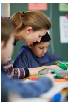
Bild 1: Pädagogin und Schüler beim Deutschunterricht im „Endspurt 2019“ im Frankfurter Schullandheim Wegscheide bei Bad Orb