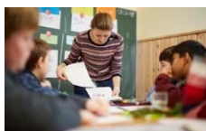
Bild 2: Pädagogin und Schülergruppe beim Deutschunterricht im „Endspurt 2019“ im Frankfurter Schullandheim Wegscheide bei Bad Orb